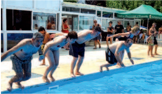
Una representació d'autoritats locals es va capbussar al migdia a la piscina municipal

Montcada i Reixac va nedar 50.600 metres a favor dels afectats per l'esclerosi múltiple. Un total de 55 persones va participar el 12 de juliol a la campanya 'Mulla't', que va tenir lloc a la piscina municipal de la Zona Esportiva Centre. Durant la jornada, es van recollir al voltant de 600 euros, en concepte de donatius i a través de la venda de productes promocionals com samarretes, gorres i tovalloles.