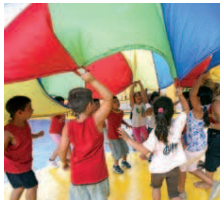
El Casal Esportiu ofereix activitats lúdiques, de lleure i aquàtiques