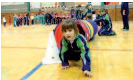
La festa de presentació és una de les activitats més multitudinàries

Núria Sánchez | Redacció Coincidint amb l'inici del curs escolar –el 14 de setembre–, el Consell de l'Esport Escolar de Montcada (CDEM), l'Institut Municipal d'Esports i Lleure (IME) i les AMPA de les escoles obriran les inscripcions per a la Lliga Escolar 2009-10. El programa inclou les disciplines de multiesport, psicomotricitat, futbol sala, bàsquet, handbol i korbball. També es faran jornades d'esports alternatius abans