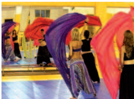
La dansa oriental és una de les disciplines consolidades entre el públic femení