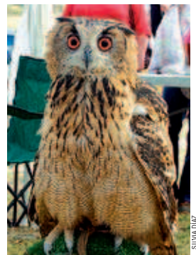
Un mussol, a la fira de l'any passat

de Vargas de gossos de mostra amb la modalitat caça pràctica sobre la perdiu sembrada. D'altra banda, l'Asfecamir ha renovat el seu conveni amb el Consistori per continuar amb la seva seu a les antigues escoles del carrer Sant Ramon de Mas Rampinyo.