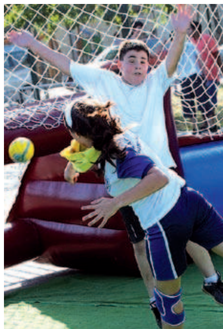
Una participant fent un llançament a la diada d'handbol al carrer