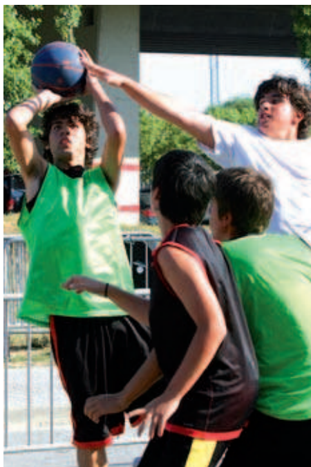
Un dels enfrontaments de la diada de bàsquet davant del Miquel Poblet

cubana i txa-txa-txa-tango, que tenen lloc fins al 29 de juliol a la Zona Esportiva Centre. En el mateix equipament, el 30 de juny es van iniciar els tallers de hip hop, dansa oriental i balls latins que acaben el 30 de juliol. Finalment, la darrera activitat del programa serà la marató d' spinning, que es farà a la plaça Lluís Companys el dia 21. Les inscripcions es poden fer a les oficines de l'IME (Tarragona, 32) al preu d'1 euro.