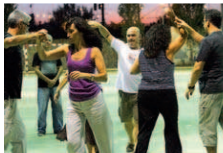
El curs de rueda cubana, txa-txa-txa i tango es pot practicar en parella