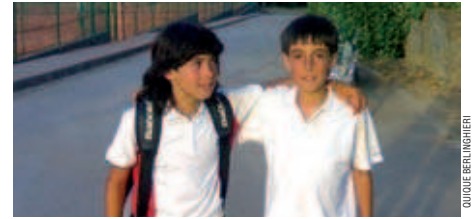
Berlinghieri i Rodríguez van ser la representació local al campionat