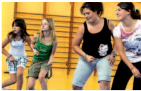
El curs de hip-hop ha tingut l'acollida entre les més joves