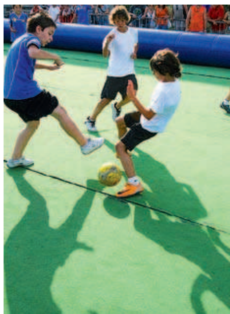
La diada de futbol va aplegar un nombre elevat de participació i de públic