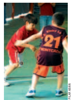
El club organitza activitats com el 3x3